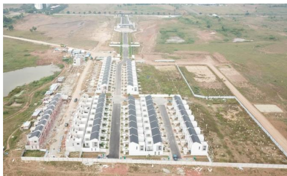
開発が進む『SAVASA』の建設現場

WPC(Wall Pre-cast Concrete)構法は、高品質、高耐久性、短工期を特長とする、当社が ASEAN 向けに導入した構法です。建設現場近くで生産したプレキャストコンクリートパネルを使用し、現場で建てこむことで、労働者のスキルに関わらず、品質の維持が可能です。また、インドネシアの住宅部材(レンガ)と比べ、強度は2倍と高く、レンガのひび割れによる雨漏りも防ぐことができます。さらに、WPC 構法は基礎工事と並行して壁や床を製造することで、建設期間を短縮し、短納期での引渡しが可能です。