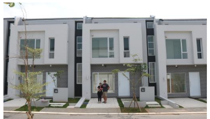
『SAVASA』第1期・「ASA」の完成住戸