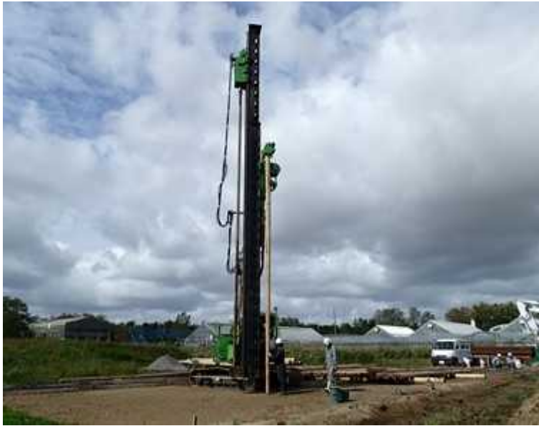
写真-1 丸太打設の様子 (秋田県立大学フィールド教育研究センター敷地内:秋田県大潟村)