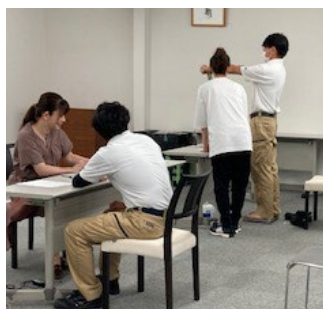
血管年齢・体のゆがみ等測定会