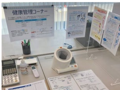
健康管理コーナー