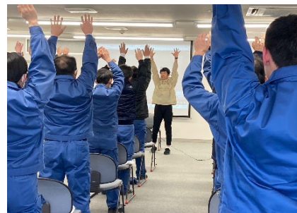
ダイエットセミナー