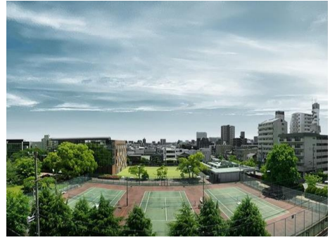
《建物南面に広がる爽快なワイドビュー》