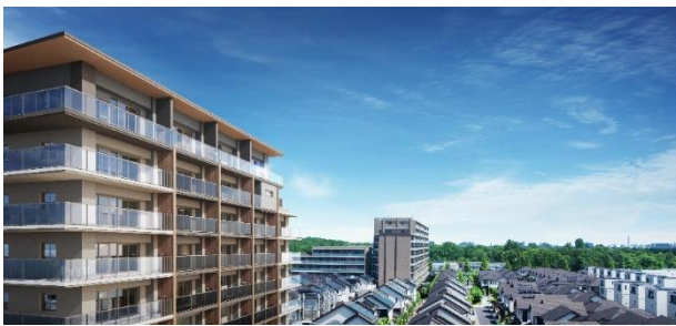
「マンションと戸建の街並みイメージ」