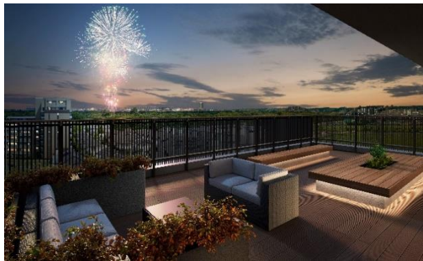
«「上層階の共用部」スカイデッキ»

さらに、マンションでは「ZEH-M Oriented」、戸建では「ZEH」（Nearly ZEH含む）に認定されており街全体で環境に配慮した省エネで快適な生活が実現します。