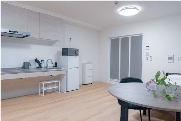
車椅子等での暮らしをサポートする「バリアフリールーム」