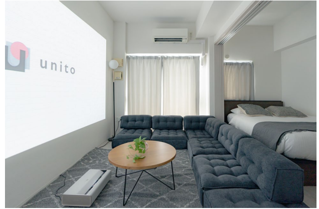
特別なひとときを提供する「シアタールーム」