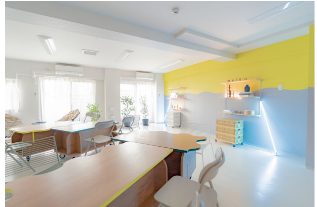
「よして」をコンセプトに掲げた「コンセプトルーム」