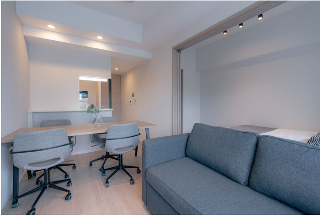
快適な作業空間を提供する「ワークルーム」