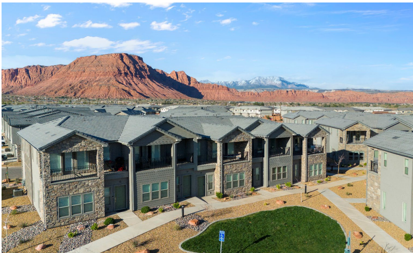
壮大な自然環境のなかにあるVisionary Homes が販売する住宅の一例