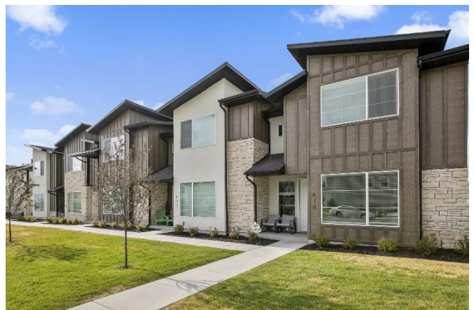
Visionary Homesが手掛ける戸建住宅、タウンハウスの建築実例