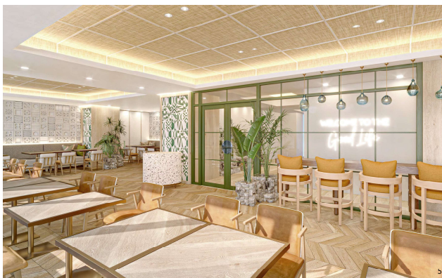
カジュアルモダンな雰囲気のレストラン