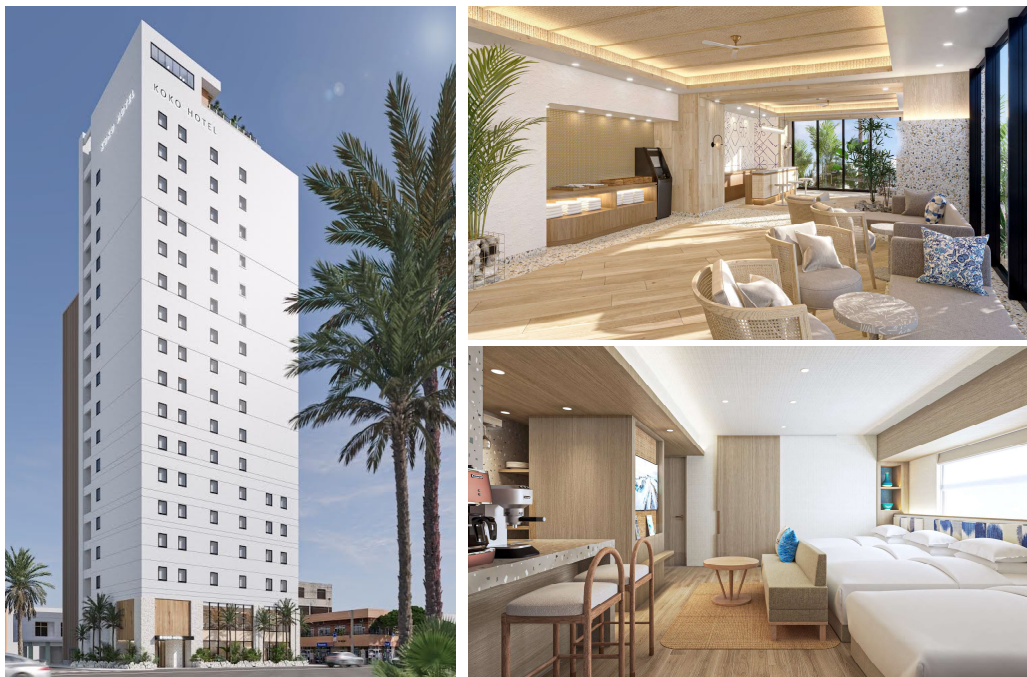
「（仮称）KOKO HOTEL 那覇前島」の外観イメージ（左）・内観イメージ（右）

ミサワホーム株式会社（代表取締役社長執行役員 作尾徹也）は、沖縄県那覇市前島で2027年3月に開業を予定しているホテル「（仮称）KOKO HOTEL 那覇前島」を2024年1月15日に着工しました。