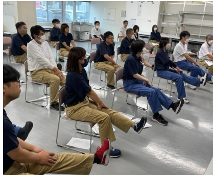
各種研修・セミナーには毎回多くの社員が参加