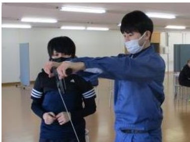
測定会で体のゆがみや血管年齢などを測定