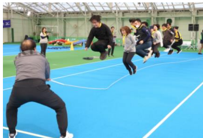
スポーツ大会を実施、社員同士のコミュニケーション促進にも寄与