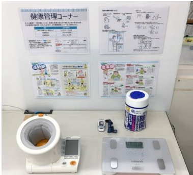
各事務所に開設した「健康管理コーナー」