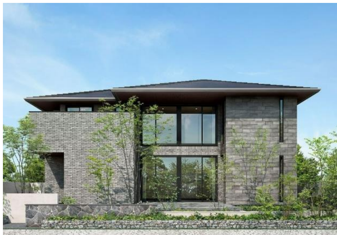
総合住宅展示場「ウェルビーみのお」(大阪府箕面市)モデルハウス ＜当社とTG オクトパスエナジー(株)の開発による新電力プランを導入＞

今回導入を開始するのは、国内にある住宅展示場142拠点 ※1 のうち118拠点(83%) ※2 。購入する再生可能エネルギー電力は、①当社とTG オクトパスエナジー株式会社が開発した新電力プラン ※3 (RE100 ※4 対応・トレース[電力出所]付)・99拠点と、②オフサイトPPAモデル ※5 ・19拠点によるものの2種で構成されます。