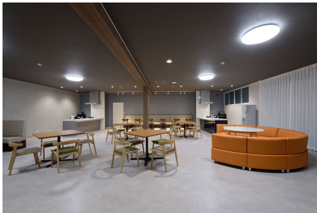
共用棟 メインリビング

玄関から寮室へ向かう廊下側にメインリビング内部を見渡せる室内窓を設け、開放的な空間にしました。リビング奥にはゆるやかにゾーン分けしたキッチンスペース、ダイニング・リラククスコーナーなどを設け、「くつろぐ」、「食べる」、「遊ぶ」、「話す」といった思い思いの過ごし方が可能なカフェのような空間づくりにより、プライベートタイムでの交流も促す工夫を施しています。