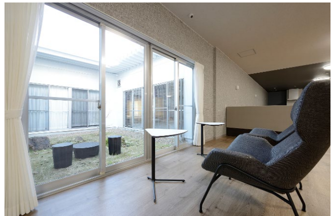
メインリビングから望む中庭