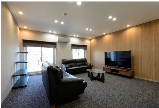
1号棟 多目的ラウンジ

1階の共用スペースには、サブリビングやワークルーム、多目的ラウンジ、浴室、フィットネスルームなど、既存の間取りと一部設備を活かしながら、老朽化の進んだ水回り設備を更新。多目的ラウンジにはパナソニック製スピーカー付ダウンライトを設置するなど、映画や音楽を満喫できるシアタースペースへ仕上げ、在宅勤務にも対応できるワークルームは、落ち着いた設えにしています。各寮室は、120室を維持したまま、ホテルライクな内装に加え、全室に内窓を設置して断熱性の向上を図りました。デスク、ベッド、ワードローブ(収納)等の家具をコーディネートしています。