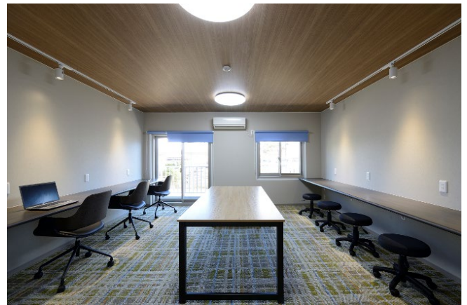
1号棟 ワークルーム