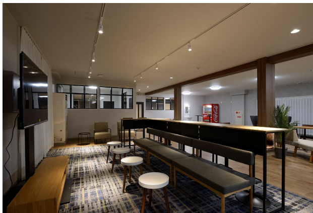
共用棟 メインリビング設置のハイカウンター

●本件に関するお問合せ先 パナソニック ホームズ株式会社 宣伝・広報部 広報課 担当：井筒・古矢・潤隨(かんずい) / TEL: 06-6834-1955