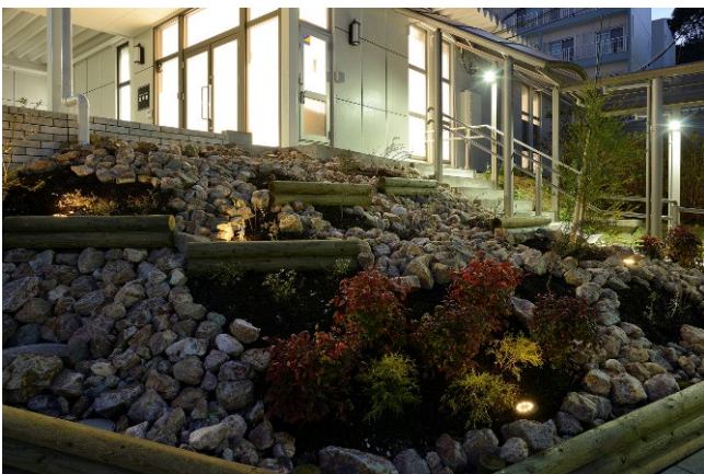
共用棟 エントランスの外構