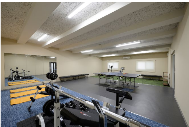
2号棟 フィットネスルーム