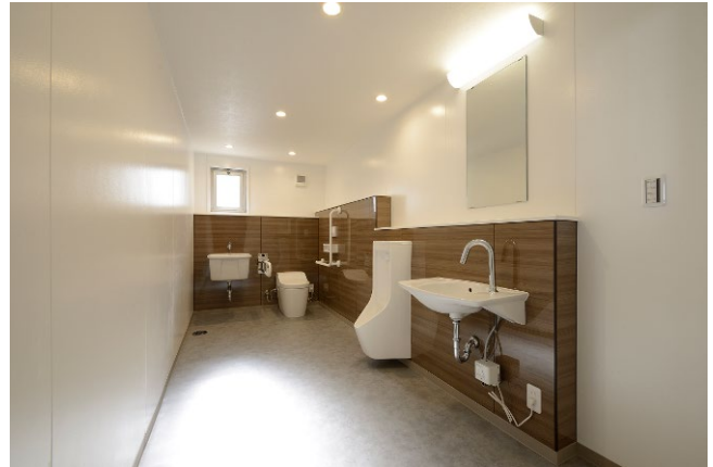
共用棟 バリアフリートイレ