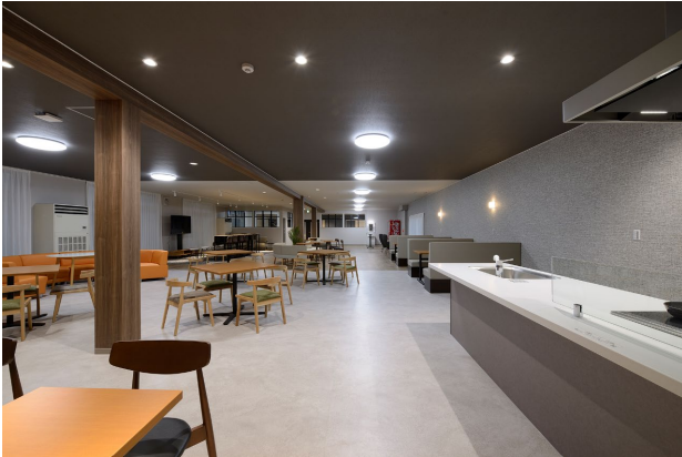
共用棟 メインリビング キッチンスペース