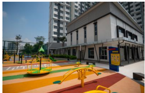
共有スペース(公園)