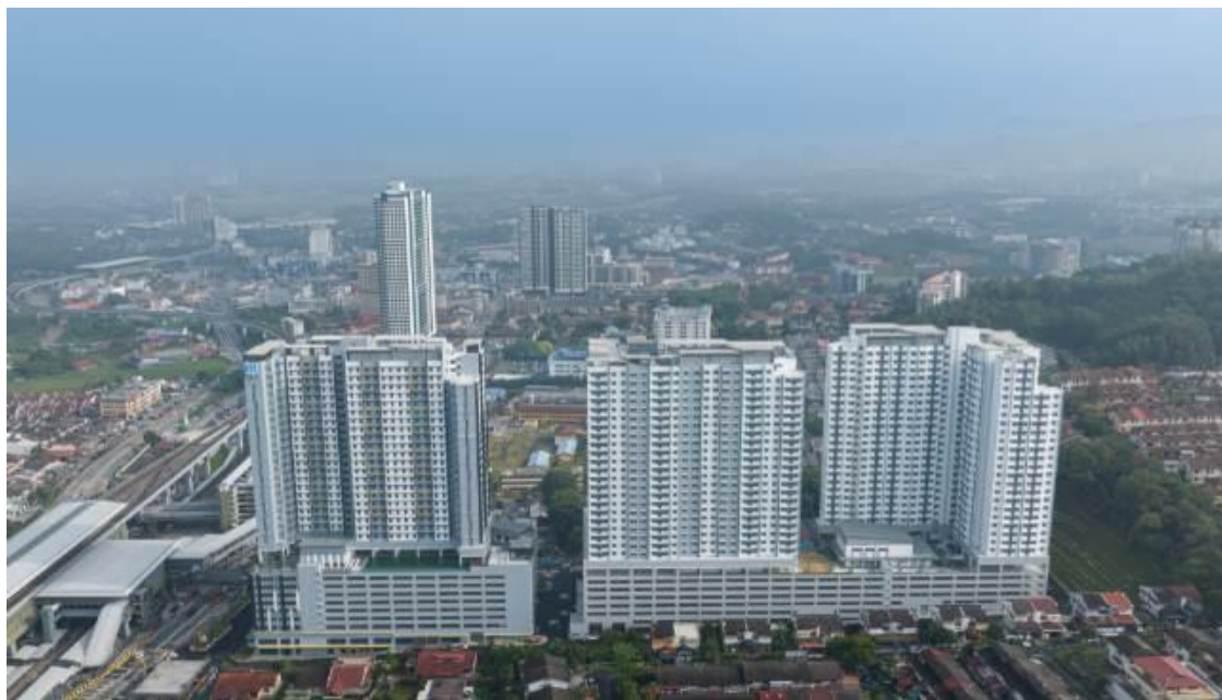
建築請負を担当した分譲マンション『NEXUS』全景 空撮

当社は、2012年にマレーシアでの住宅事業を開始して以来、戸建住宅（全1,444戸）の建築請負を中心に住宅供給を進めてきました。また、当社初となるSENTUL（セントウル）のマンション（500戸）の建築請負以降、1,000戸超のマンション2棟を次々と竣工することで、マレーシアにおける戸建住宅・マンションの供給総戸数は約5,000戸に達する見込みです。