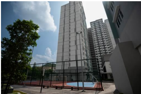
共有スペース(バスケットコート)