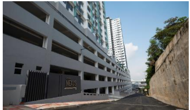
マンションエントランス