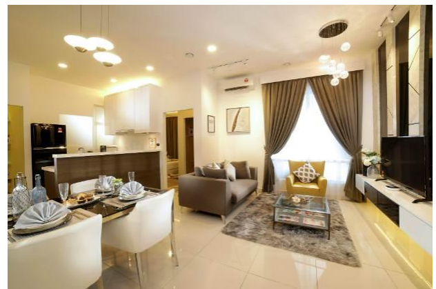
室内イメージ(モデルルーム画像)