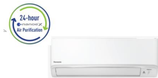
採用予定のパナソニック空調システム