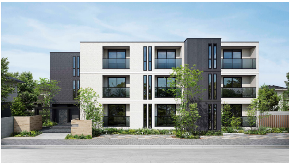
トヨタホームの賃貸住宅

トヨタホームは今後もお客様のニーズに細やかに対応し、安全・安心かつ快適な賃貸住宅を提供してまいります。