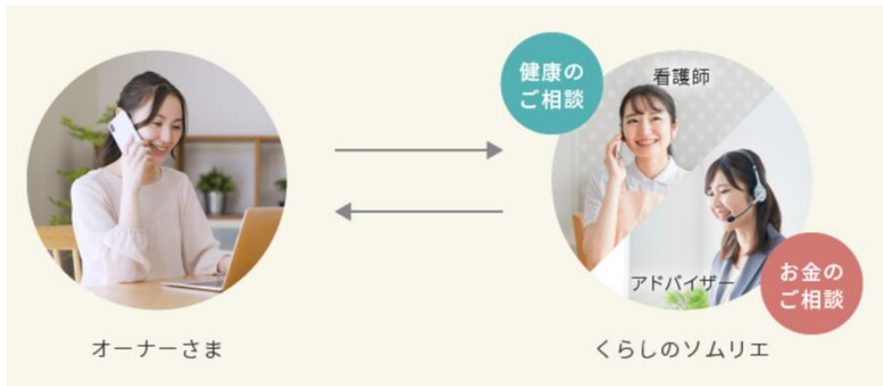
『くらしのソムリエ』 “健康”“お金”の相談サービスイメージ

当社とアフラックは、お客さまの満足を目指して生涯にわたりつながり続ける理念や、「お客さまの多様な困りごとや関心事にお応えしたい」という共通の思いを持ち、このたびの協業となりました。今後も、『くらしのソムリエ』について協業の進展を進めてまいります。※1