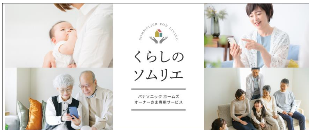
『くらしのソムリエ』トップページ

同サービスは、今後もさまざまな専門のパートナー会社とアライアンスを組んで、お役立ちできるサービスを順次拡大・拡充を図る予定です。