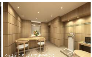
ウェルネス・ラウンジ完成予想CG