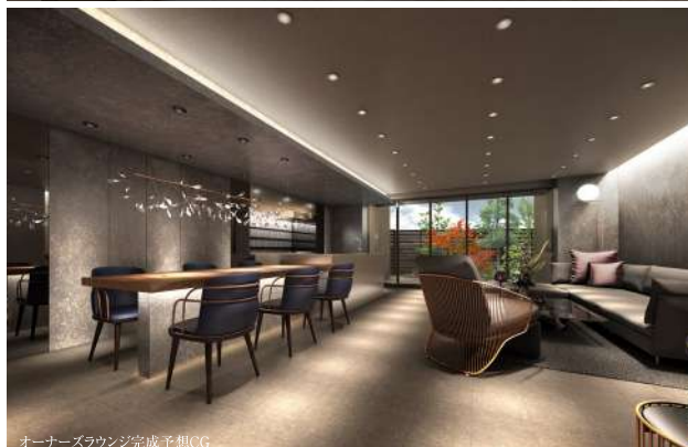
オーナーズラウンジ完成予想CG