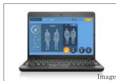
ゆがみチェッカー