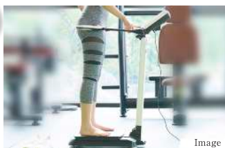
ウェルネス・ラウンジ