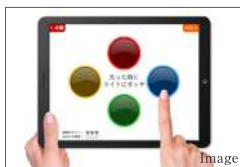
認知症予防トレーニング

関西医科大学健康科学センターの健康運動指導士が館内のオーナーズラウンジにて健康プログラムを適宜実施。管理栄養士や公認心理士などがセミナーや栄養指導を実施。また、認知症予防トレーニングやゆがみチェッカーを利用した様々なエクササイズも提案します。