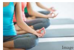
健康運動プログラム健康セミナー