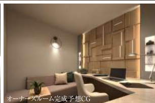
オーナーズルーム完成予想CG