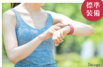
リストバンド型ウェアラブルセンサー

健康寿命を延ばすには、何よりも日常の体調変化に気づくことが大切です。そのためにも人間ドックのデータと日々の運動量・睡眠記録・体重・血圧・脳機能評価などのバイタルデータ収集により体調管理を行うシステムを導入。蓄積データを基に医師、健康運動指導士、管理栄養士などが多彩な健康増進のサポートを行います。