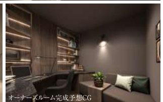
オーナーズルーム完成予想CG