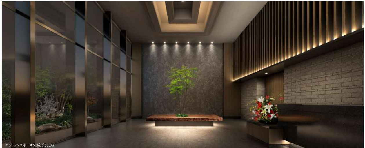
エントランスホール完成予想CG

ター、ウェルネス・ラウンジも人の温もりを感じる空間として、安らぎをもたらしてくれるはず。また、ニューノーマル時代の在宅ワークを見据えた空間機能として、完全個室のオーナーズルームも2部屋設けました。人生100年時代を迎える、次なる象徴として。世代を超えた新しい住まいの価値創造がはじまります。