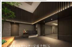
コンシェルジュカウンター完成予想CG