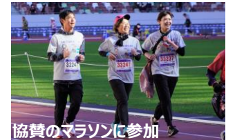
協賛のマラソンに参加

社員の健康意識の向上と運動する機会のきっかけづくりを目的に、「新宿シティハーフマラソン・区民健康マラソン」に協賛。事前に複数回の練習会を開催して交流を深めながら、約 60 名の社員が競技に参加しました。