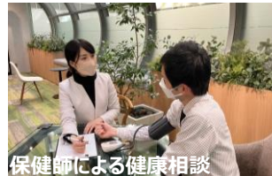
保健師による健康相談

2018 年に本社に健康管理室を設置。健康診断の結果に関する内容や新入社員や異動者の環境変化に伴う不調など、多岐にわたる健康相談や、不調者が休憩できる救護室があり、多くの社員が利用しています。