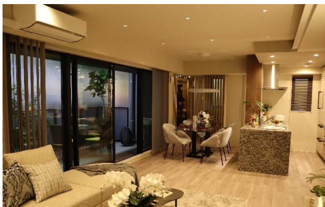
《開放感のある居住空間》