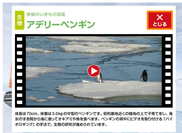
ポイントをタップすると映像や画像のパネルがポップアップ

※ 1 ：「南極ウォークビュー」は 2014 年度キッズデザイン賞を受賞しています。（ リリースはこちら ）