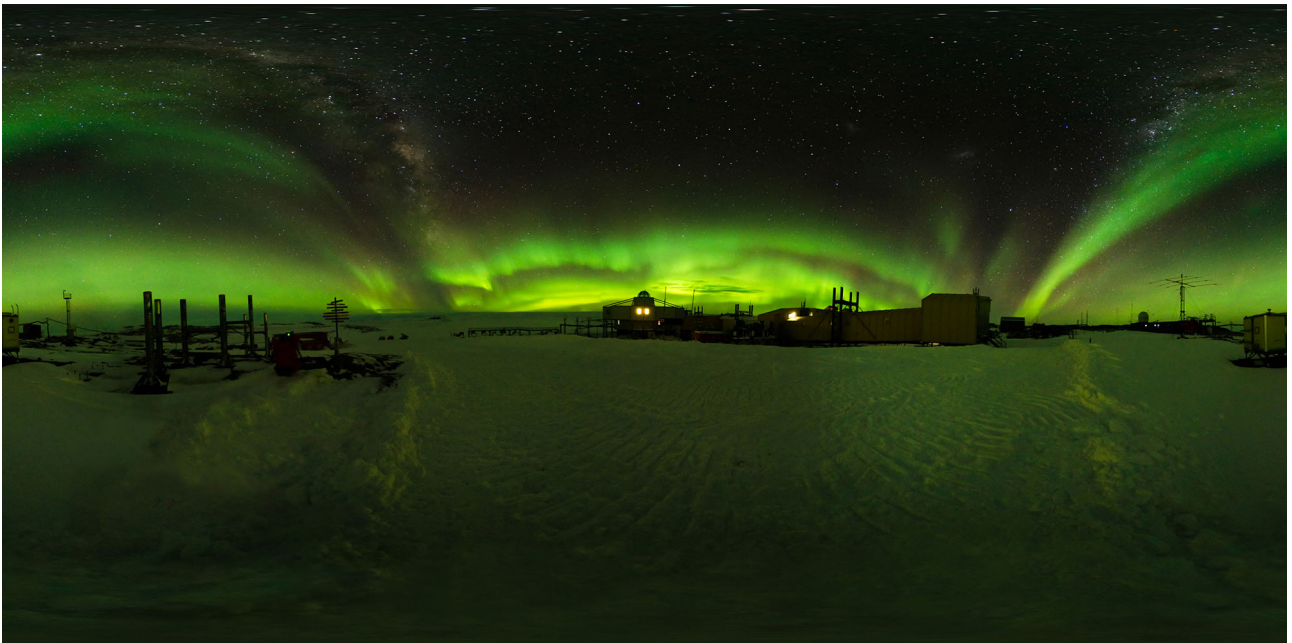
昭和基地の上空に広がるオーロラ（「南極 e スクール」の 360 度パノラマ画像を平面に展開）