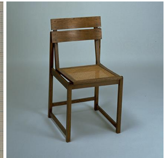
エーリッヒ・ディークマン 《小椅子》1928年頃

ミサワホーム株式会社（代表取締役社長執行役員 作尾徹也）は、島根県立石見美術館にて開催される「交歓するモダン 機能と装飾のポリフォニー」展に特別協力し、所蔵する「ミサワバウハウスコレクション」の作品24点を出展します。なお、本展覧会は既に愛知県、豊田市美術館での開催を終えており、また12月からは東京都庭園美術館に巡回する予定です。