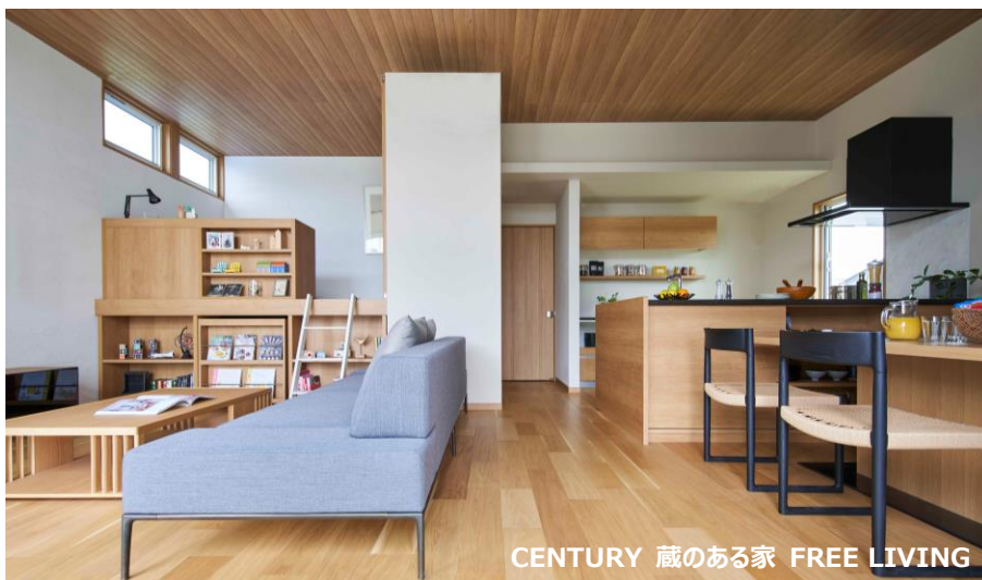
CENTURY 蔵のある家 FREE LIVING