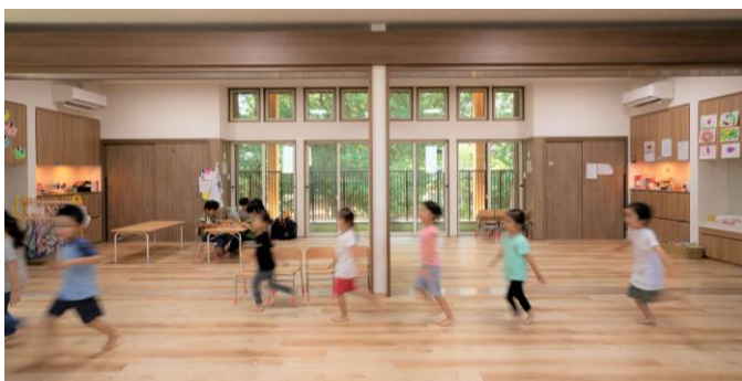
神社の緑あふれる境内へとつながる、見通しの良い保育室

建物の外観は、柱を連続させて木質感を強調することにより歴史ある神社との一体感を醸成。また、風と光が心地よく抜ける見通しの良い保育室からは、神社の緑あふれる境内が見渡せて自然と向き合える配置になっています。あわせて、園庭デッキや芝テラスなども設けることで、神社と関わりのあるコミュニティとの豊かな出会いを創出。日々の子どもの活動を表出することにより、地域の見守りを充実させています。