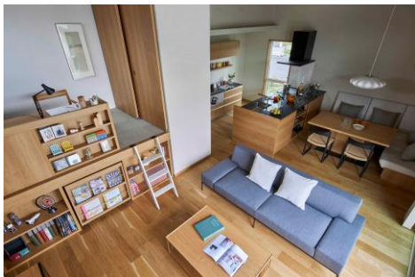
多彩な暮らしを快適にする約3mの高天井リビング

リモートワークや在宅学習が浸透して親子ともに自宅で過ごす時間が増えるなか、趣味や仕事、学習など家族の多彩な暮らしを快適にサポートする住まいです。約3mの高天井リビングに下部を収納スペースとして利用しながら上部のスキップフロアを自由に活用できる「フリーリビングユニット」や、「可動ウォールパーティション」によってマルチスペースを仕切れる空間提案により、家族がほどよくつながりながら、それぞれの時間も大切にできる心地よい空間を実現しています。