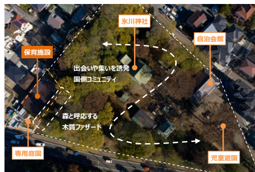
隣接する神社との親和性の高い配置計画