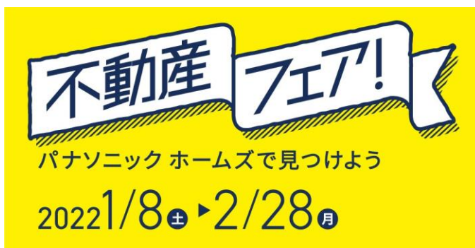
『パナソニック ホームズ 不動産フェア』ロゴ

また、コロナ禍で不要不急の外出を避けたいお客様には、「リモート見学」が可能な会場も用意し、「リアルとバーチャルでのおうち探し」ができる内容になっています。「リモート見学」では、営業担当者が、物件の周辺環境や建物内外の概要・特長について、パソコン・スマホ・タブレットを通じてライブ映像と音声でお客様にご説明します。お客様は、自宅に居ながら、いつでも簡単に物件情報を入手いただくことが可能です。