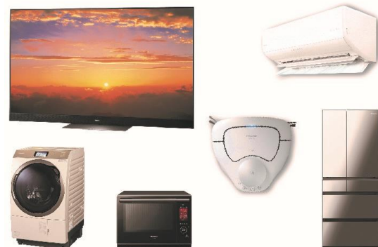
「ご成約特典」(イメージ)