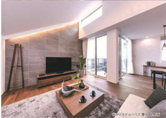
街かどモデルハウス 豊中 上野坂