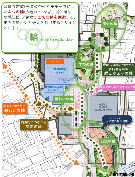
■ゾーニング・施設配置・動線計画