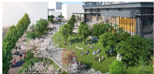
■子供の笑顔が絶えない緑の広場「学びの場」