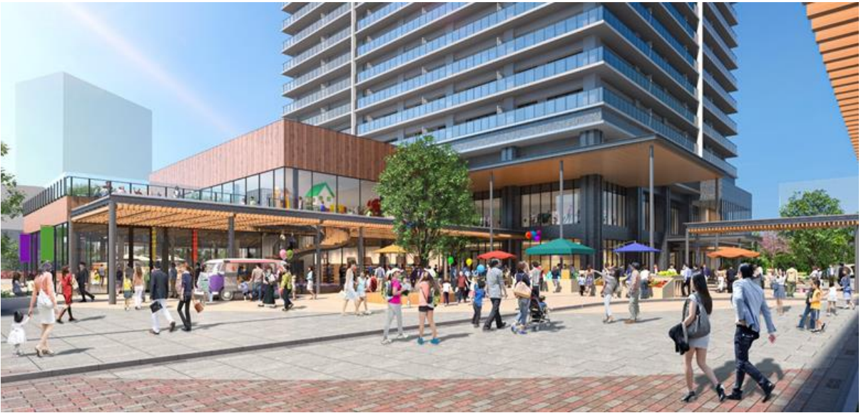
■シンボルロードと一体化したまちの中心となる広場「賑わいの場」