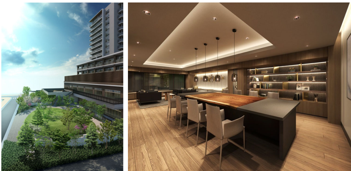
緑豊かなオーバルパークとテレワークに対応したオーナーズラウンジのイメージ

そして、エントランスや宅配ボックスの開錠、エレベーター操作など、建物入り口から各住戸までの共用設備を非接触仕様にしたほか、建物 6 階に設けたマンション入居者専用のオーナーズラウンジには、Wi-Fi 環境に加えテレワークに対応した大テーブルやリモートブースを配置。また、住戸についても、全タイプに在宅ワークができるマルチスペースを設けたプランを用意するなど、ニューノーマルの暮らしをより安全安心で豊かにする提案をしています。