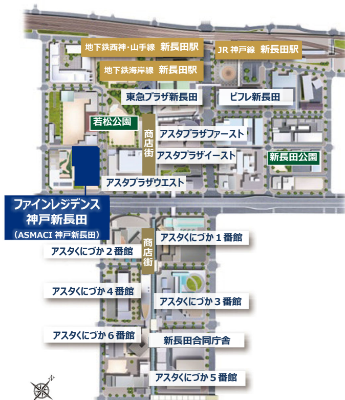
再開発エリアイメージ（白枠は商業施設を備える建物）