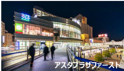
アスタプラザファースト