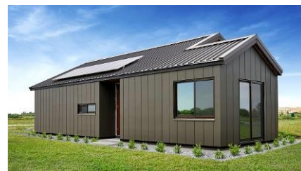
ワイカト ショーハウス リアビュー