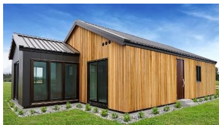
ワイカト ショーハウス フロントビュー