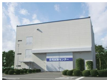
住宅試験センター(滋賀県・湖東工場)

今回、NZ スマートビルドテクノロジーズ社へ提供するパナソニック ホームズ社製の住宅部材は、大型パネル構造(F 構法)をベースとします。外壁や床、屋根、架構体などを大型のパネルで製造し、これらを強靱なボルトとジョイント金具で一体化させた強固なブロック体とすることで、構造体全体で荷重をしっかりと受け止める「モノコック構造」となっています。日本国内には、厳しい気象条件や巨大地震に耐えられる住宅づくりを目指し、自社工場内に実物大住宅 2 棟を収容できる住宅試験センターを保有。日本の暴風雨や夏冬の厳しい温度・湿度環境を再現して検証を行っています。さらに、耐震性能を確認するために、日本最大級の実験施設での実物大住宅の耐震実験を油圧能力の限界近くまで繰り返し、構造の強さを実証しています。