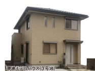
現地モデルハウス(3号地)