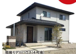
現地モデルハウス(4号地)