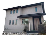
現地モデルハウス(1号地)