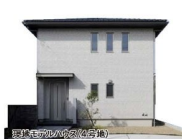
現地モデルハウス(4号地)