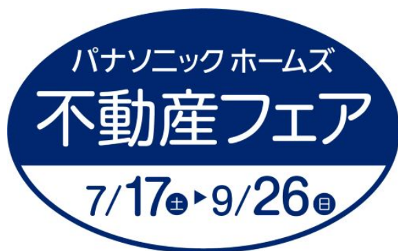
『パナソニック ホームズ不動産フェア』ロゴ

なお、期間中、分譲物件の現地にWEB予約の上ご来場いただいた方には、「災害に備える」住まいの知恵と工夫を紹介した「安心BOOK」と、普段は夜間のウォーキングやアウトドアに、万一のときは非常用・防災用ライトとして使える「パナソニック LED ネックライト」をセットにした、「防災に役立つ安心BOX」をプレゼントします。(数に限りがありますので、無くなり次第終了します)