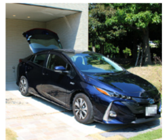
もしもに備えるレジリエンス仕様 ◆「クルマ de 給電」