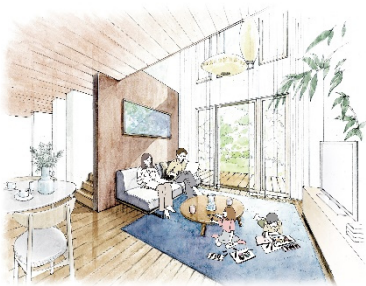
居心地のいいリビング ◆大きな吹き抜け