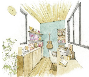
ONもOFFも充実 ◆ホームオフィス