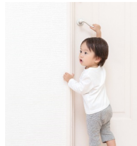
住まいの感染予防 ◆ホームコーティング